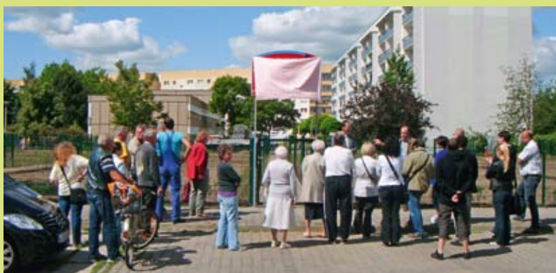
Künftige Schrebergärtner und Gutburg-Mieter freuten sich bei der Eröffnung am 27. Mai 2011 darauf, die »Grüne Aue« in Besitz zu nehmen.

Gartenanlage Grüne Aue Gutburg Mieterservice