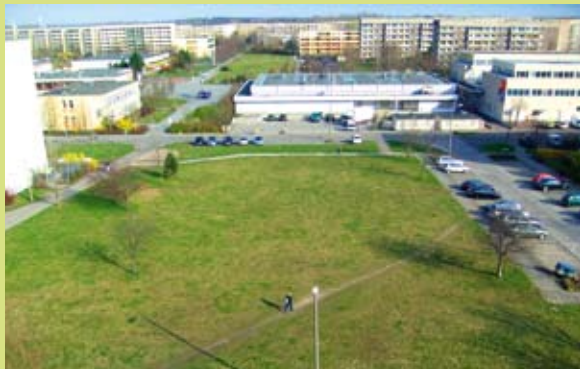
Jupiterstraße 39: 3.200 m 2 ödes Brachland bis April 2011