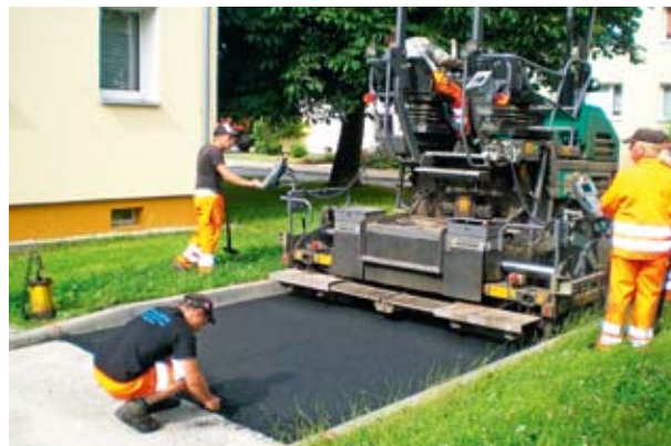
Straßenbauer erneuern die Zufahrt zum Haus Nr. 65

Kaum war die Nachricht raus, stand auch schon der Gutburg Mieterservice auf dem Plan: Die Erneuerung der Martin-Ephraim-Straße durch die Stadt Görlitz nahm der schnell entschlossene Eigentümer der