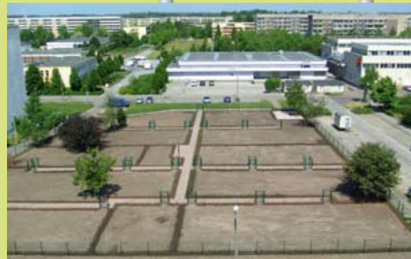
Eine Idee wird Wirklichkeit: Blick auf die noch un bebauten Schrebergärten.