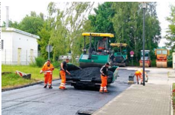
Asphalt für die Martin-Ephraim-Straße