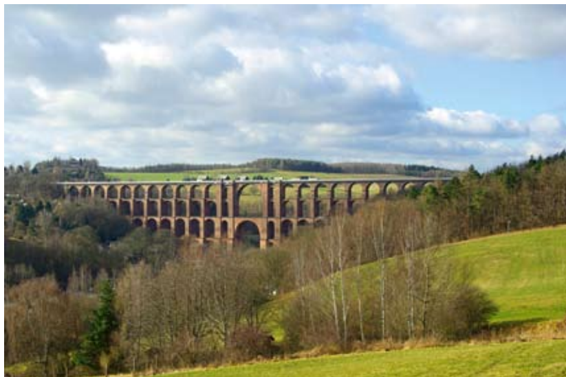
Die Göltzschtalbrücke – größte Ziegelbrücke der Welt