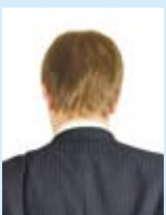
Ihr Gutti Gutburg Mieter

... dieser ›Gutmenschen-Sprech‹ geht mir auf die Nerven. Unsere Sprache strotzt davon. ›Migrationshintergrund‹ ist so ein Wort. Was soll das eigentlich darstellen? Ist nicht Deutschland ein einziger Migrationshintergrund? Meine Urgroßmutter zum Beispiel. Sie kam aus Schlesien. Demnach bin ich – zumindest teilweise – Deutscher in vierter Generation oder was? Wenn ich mich permanent ›politisch korrekt‹ ausdrücken wollte, wie es heute angesagt ist, dann würde mich am Ende keiner mehr verstehen. Soll nicht heißen, ich sei gegen das Nachdenken – möglichst vor dem Sprechen. Da muss ich mir neulich anhören, meine Jeans gehöre in den Müll, meine Aufmachung sei ›assig‹. Ist es meine Hose oder die Schublade meines Gegenübers, in der Bilder stecken, die ich lieber gar nicht sehen möchte? So oder so, keiner von uns ist davor gefeit, den eigenen Vorurteilen aufzusitzen. Das Nützliche an ihnen: ein Dasein ohne Zweifel nach dem Motto ›Geh' mir weg mit deiner Lösung, sie zerstört ja das Problem‹. Wenn ich meinen eigenen Vorurteilen mal vorurteilsfrei begegne, stelle ich fest, dass ich doch lieber selber denke. Sonst ›werde ich vielleicht gedacht‹. Von alten und neuen Ideologen zum Beispiel, die nur darauf warten, ein bisschen Ordnung zu bringen ins höllisch unbequeme Chaos des Zweifels, der Leben heißt.