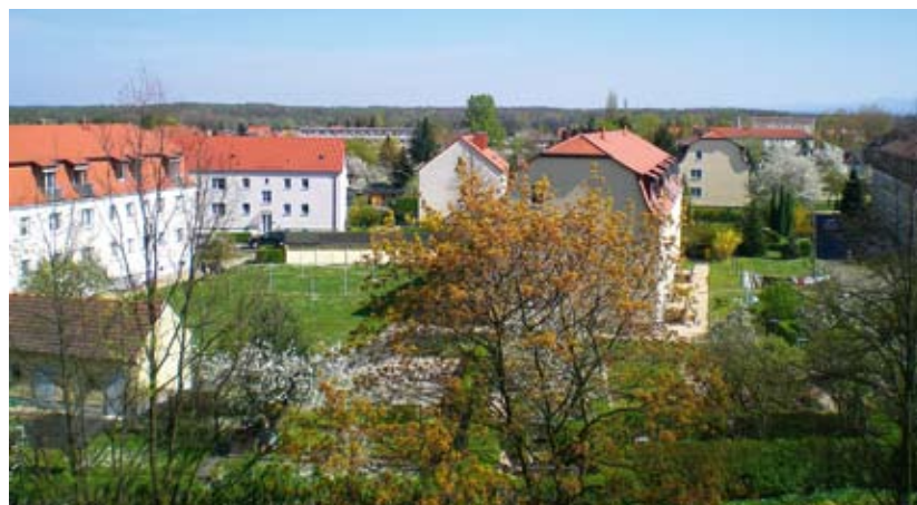
Aussicht in der Albert-Blau-Straße – aus einer der 763 Wohnungen, die der Gutburg Mieterservice in Görlitz betreut.

Die Angebote aus dem Bestand des Gutburg Mieterservices sind zum sofortigen Bezug. Bitte nehmen Sie Kontakt zu Ihrer regionalen Geschäftsstelle auf.